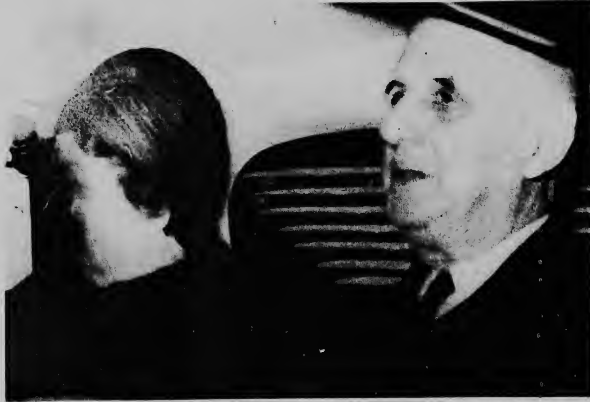
PARIS--E presidente frances Charles de Gaulle ta bai Palacio Elysee bek cu su esposa despues cu el a ser reeligi como presidente.

E campeon peruano a manifestá cu mientras e ta regla su pelea cu Peralta e ta desea di keda activo y cu despues di e fiestanan di fin di anja lo e reanuda su entrenamiento den un forma intenso pa su pelea cu Urra.